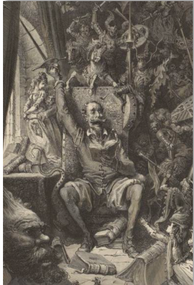
Dessin de Gustave Doré pour L'Ingénieux Hidalgo don Quichotte de la Manche, par Miguel de Cervantes Saavedra

4) Enfin on peut proposer aux élèves un prolongement au débat